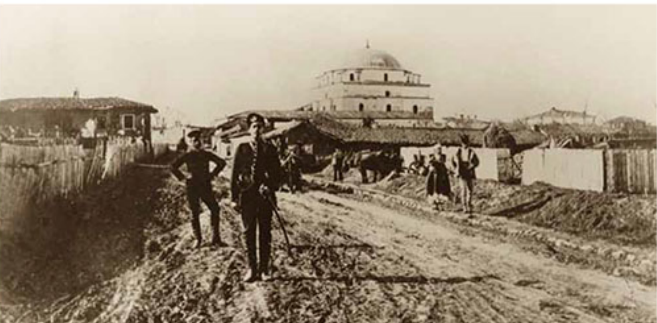
Улица „Самоковска“ и Черната джамия (днес ул. „Граф Игнатиев“ и църквата „Св. Седмочисленици“), 1887 г. Samokovska Str. and Black Mosque (now Graf Ignatiev Str. and a church „St. Seven Saints“), 1887