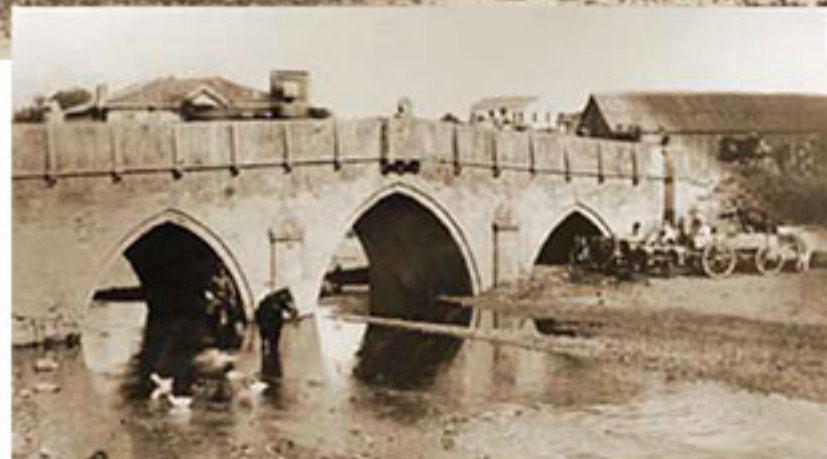
Изглед на София от северния бряг на Владайската река. На преден план е Шареният мост (днес Львов мост), 1879 г.